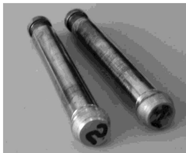
Рис. 7.14. Коррозия штоков из стали 25Х1МФ в зоне контакта с сальниковой набивкой:

образец 1 — КГФ-Г (содержание графитовой части 99,5%), точечная коррозия в зонах контакта образца с сальниковой набивкой; образец 2 — КГФ-Д (содержание графитовой части 99,8 %), незначительная точечная коррозия в зонах контакта образца с сальниковой набивкой. Рабочая среда — водопроводная вода. Продолжительность испытаний 7 мес, с 28.05.2001 г. по 21.06.2002